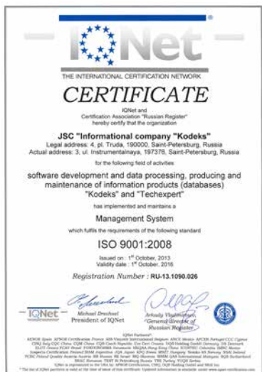
сертификат IQNet – дополнительный сертификат с аккредитацией в 50 странах мира.

Охрана труда и безопасность на предприятии. Специальное издание для пользователей «Техэксперт»