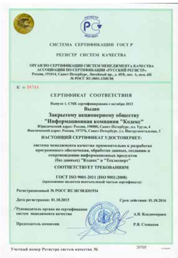
сертификат соответствия национальному стандарту ГОСТ ISO 9001-2011.