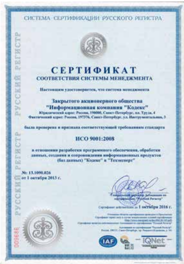
сертификат соответствия международному стандарту ИСО 9001:2008.